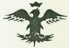
3. AVRUPA HUN IMP. 375-454