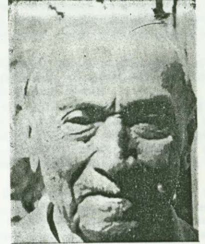
Ferid TEK'in 7 Mart 1970'de 92 yaşında iken alınmış bir resmi.