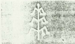
9. KARAHANLILAR 940-1040